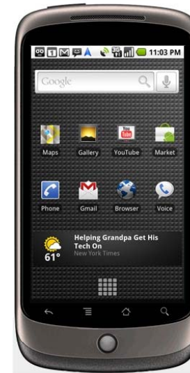
GOOGLE / HTC