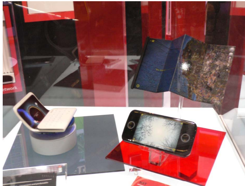
Concepts Kyocera – Stations LTE MWC 2010