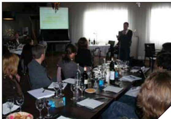
Réunion d'un des Club AEC

Plusieurs formules permettent cette émergence