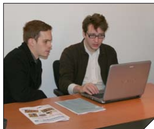
Les premiers résidents de l'auberge