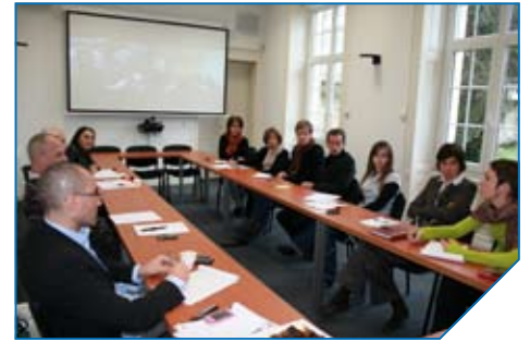
La salle de réunion