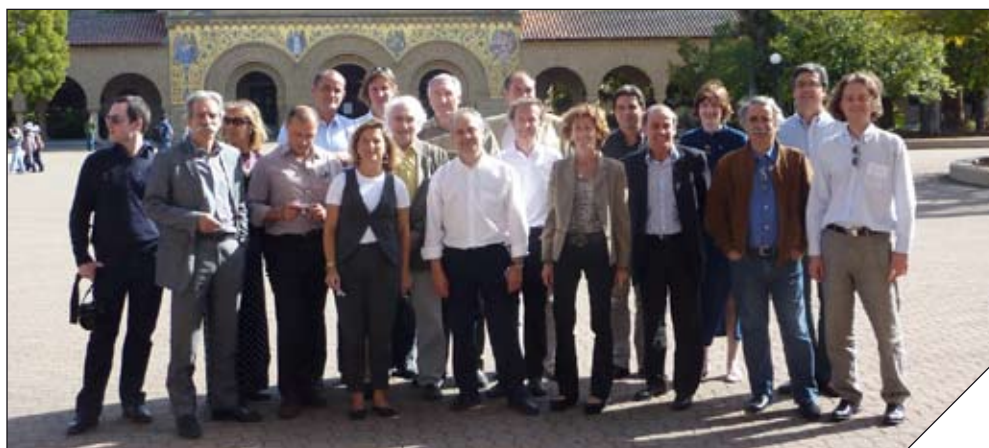
La délégation de la mission Silicon Valley en mai 2010

Elles ont également une vocation de prospective en matière de numérique et d'analyse d'initiatives originales. Les enseignements tirés de ces missions sont exploités pour susciter un échange.