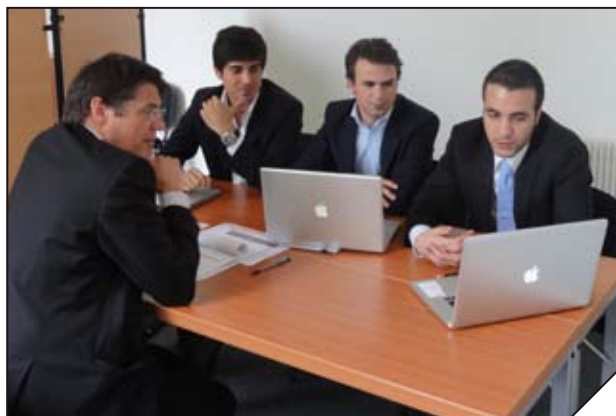
Un espace de travail collaboratif

Dans le cadre de l'Auberge numérique, AEC suscite et favorise la conception de prototypes et de pilotes, en vue de leur déploiement ultérieur sur le territoire.