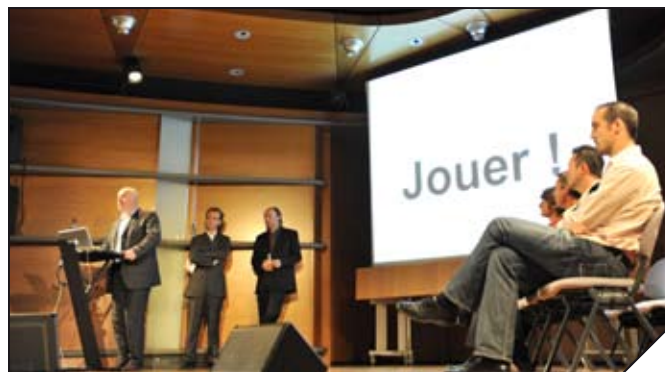
Le dernier Carrefour qui s'est déroulé à Pau

Cet événement, initié par la Fondation Internet Nouvelle Génération (FING) et organisé par un ensemble d'acteurs aquitains, donne la possibilité à des créateurs ou des porteurs de projets de mettre en valeur un usage innovant, de dynamiser les contacts et les échanges d'informations.